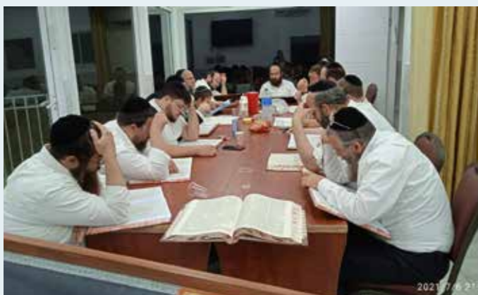
מגדל אור לכל תושבי הרחוב שיעור גמרא קבוע בבית הכנסת חבד ברחוב אבא שאול