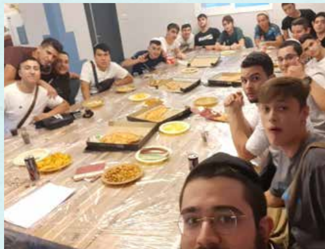
השיעור הראשון במועדון החדש

לאחר שראינו שהשיעורים הרבים מעניקים לבני נוער את המקום להתקרב, להתחבר ולשאול שאלות, החלטנו לקחת את הפעילות צעד אחד קדימה ולפתוח שיעור שבועי גם לרציניים יותר. במסגרת פרויקט בתי המדרש של חב"ד לנוער התחברנו עם ישיבת 'תומכי תמימים' השוכנת קרוב למרכז העיר. פעם בשבוע מגיעים הנערים הרציניים ללימוד עם בחורי הישיבה שיחות של הרבי. זו תופעה חסרת תקדים: נערים מסולתה ושמנה של האוכלוסייה הכללית בירושלים מבקרים בישיבה ולומדים בחיות עם בחורים כמעט בגילם. ההשפעה של הלימוד פנימית ומשנת חיים. עתה, עם הקמת המקום החדש והמרווח, הלימוד המשותף יתקיים בו ובחילא יתיר.