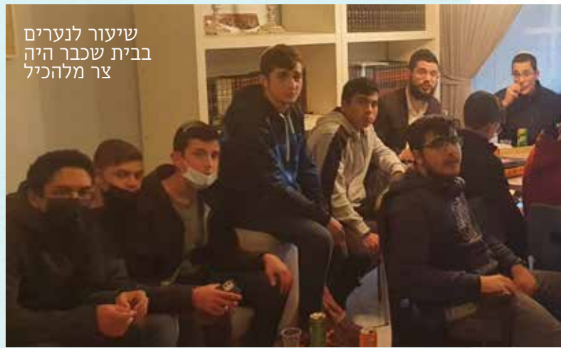
שיעור לנערים בבית שכבר היה צר מלהכיל