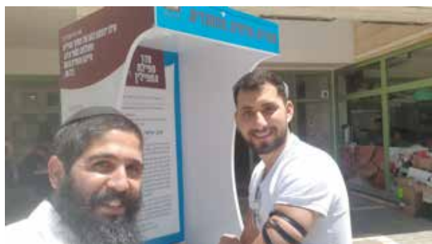
אור מתוך החושך. דוכן התפילין החדש של חב"ד בקמפוס מכללת אשקלון שהקמתו אושרה לאחר נפילת הטיל