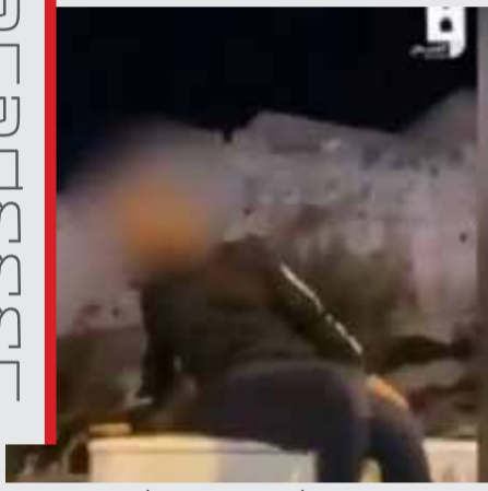
תיעוד מהרשתות של הצעירים המוסלמים

זה קורה אחרי שנה של קורונה שבה סומנו החרדים כמפיצי מחלה והוכו עד זוב דם ברחובות העיר ועל ידי כלי התקשורת הכלליים, כשהדובדבן שבקצפת היה מסע השנאה והרדיפה של ליברמן בקמפיין בחירות שלא היה מבזה זמנים אפלים מאי שם באחד ממסעות רדיפת היהודים בהיסטוריה