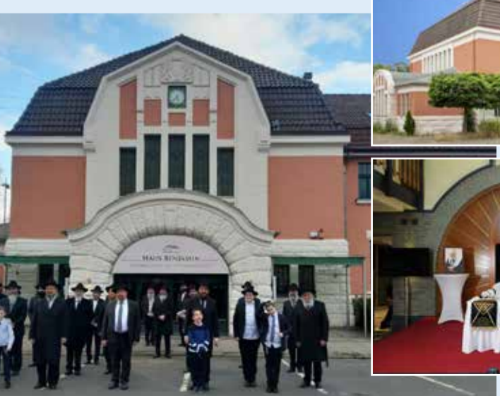
מראות מחנוכת בית חב"ד

ורוגמת למחישות ועוצמה רוחנית אמונית יהודית, והדברים קיבלו הדר רב בכלי התקשורת, שנקראו ונצפו על ידי עשרות מיליונים. "בקרוביי אקדש" גירסת הנובר ה"תשפ"א. "בית בנימין" שבהנובר אינו בית לזכר השליח, או על שמו, או לעילוי נשמתו. זהו הבית שלו, הבית שבו חייו הרוחניים שהם חיי האמיתיים ממשיכים לפעם ולחיות. "מאת ה' הייתה זאת". התפתחות והתעצמות השליחות בהנובר בשנה החולפת חרף האסון והשבר היא לחלוטין המעלה מהטבע.