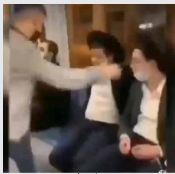
טורו מתועד. ערבים מכים חרדים בלב ירושלים, השבוע

בחסות רשת חברתית של בני נוער, החלו צעירים מוסלמים לתעד את עצמם משפילים חרדים באלימות בירושלים, ומצחקקים להנאתם • מה שהחל בסרטון אחד שנחשף בתקשורת, התברר מהר מאוד כתופעת טרור חמורה ומסוכנת שהולכת ומתרחבת • "כל האירועים הללו הם התפרצות הר געש", אומר הנציג החסידי בעיריית ירושלים הרב יעקב הלפרין, "בתי המשפט לא מספקים מענה פסיקתי ראוי ונכון כלפי התוקפים, כך שהם לא חוששים להמשיך במעשיהם"