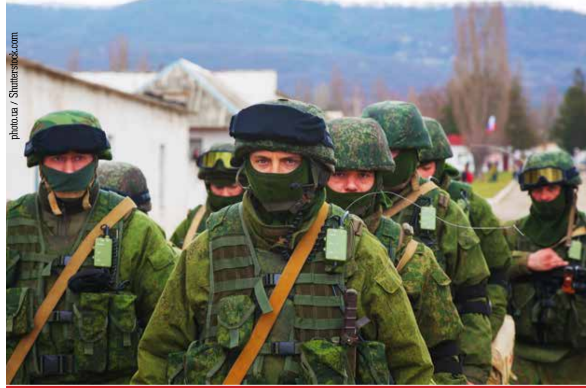
חילי צבא רוסיה

רוסיה המשיכה השבוע בפריסת כוחות מדאיגה סביב אוקראינה. לא פחות מ־150 אלף חיילים – מספר אדיר בכל קנה מידה (ורק לשם השוואה, מספר החיילים הסדירים בצה"ל עומד על 176 אלף) – התפרסו באזור • וכרגיל, מאחורי הקלעים, יש הרבה מעבר למלחמת רוסיה-אוקראינה