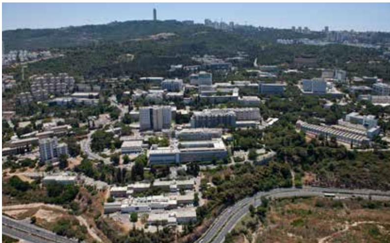
קרית הטכניון בחיפה

“כששליח חדש בא למקום, לא תמיד מקדמים את פניו במאור פנים. כשליח תחת שליח, זכיתי להגיע למקום פעיל ושוקק, שלא היה צריך להתחיל בו דברים מאפס. כולם כבר מכירים את חב"ד ואת פועלה הנרחב ורוצים לבוא ולהשתתף”