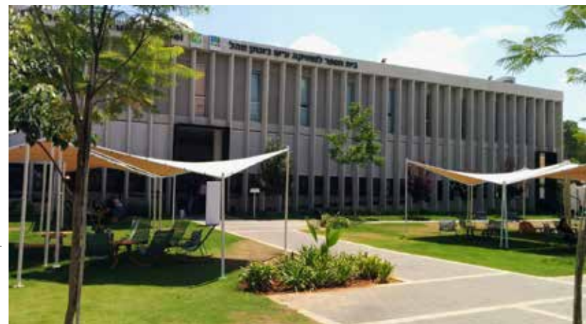
מכללת קרית אוננו