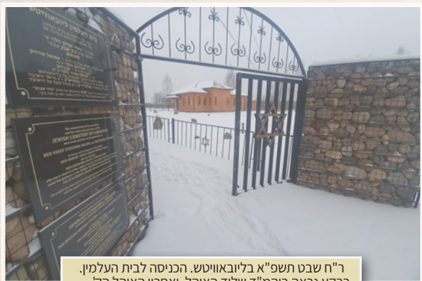
ר"ח שבט תשפ"א בליובאוויטש. הכניסה לבית העלמין. ברקע נראה ביהמ"ד שליד האוהל, ואחריו האוהל הק'.