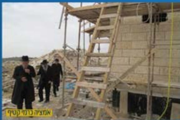
אמציה ברני קסיף