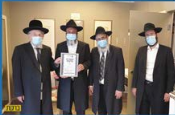
מזל של שו"ת