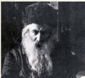
המשפיע הגה"ח רבי דוד צבי חן (הרד"ץ)

מצטייר לו כספירת החסד בצירור רוחני ויצחק מידת הגבורה וכו' ומרגיש את האלוקות שבתורה. אבל אצל תלמידי התמימים הלומדים בתומכי תמימים הנה מיד בתחילת לימודם נרגש הציור הרוחני ומאבדים מכל וכל את הציור הגשמי שבתורה, אצלם אלקות בפשיטות ובלי עבודה ככר בתחילת הלימוד הם מרגישים את הקדושה והרוחניות שבתורת החסידות.