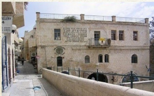
בית הכנסת צמח צדק והבניינים הסמוכים לו

ר' חיים בער היה גר בבנין צמוד לבית הכנסת 'צמח צדק' בעיר העתיקה, שם