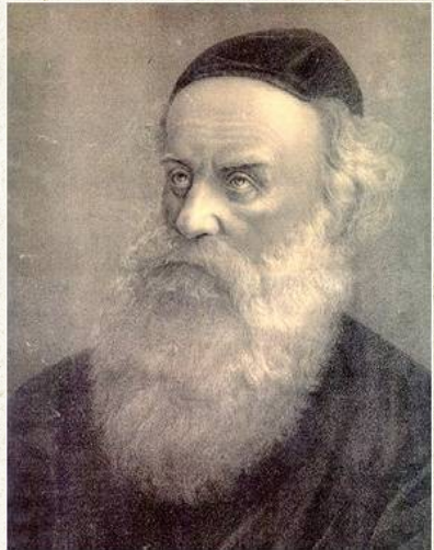
הוד כ"ק אדמו"ר הזקן

מעשה זה אירע לאחר הסתלקותו של אדמו"ר הזקן, שחסיד זה היה מחסידיו וראה אותו בצעירותו. והנה בתוך כך ראה כיצד אדמו"ר הזקן נכנס לחדר ומדבר עם חברי בית הדין. הדיינים עונים לו שהם צריכים לפסוק בדינו של האברך היושב בחדר הסמוך ומעיינים כעת במעשיו. אמר להם אדמו"ר הזקן כיצד מביאים אברך באמצע שנות חייו הרי הוא בוודאי יעשה הרבה מעשים טובים בחייו וגם יעשה תשובה אמיתית על עוונותיו, וכי ראיתם שמביאים בעל מלאכה ומבקשים ממנו חשבון על מלאכתו באמצע שמבצע את העבודה. ביקש מהם אדמו"ר הזקן את הפנקס. כל עמוד שהיה כתוב בו המעשים הטובים השאיר וכל דף שהיה כתוב בו דברים בלתי רצויים, קרע אדמו"ר הזקן מהפנקס והשליכו. כך המאזניים הכריעו לכף זכות.