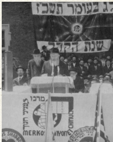
הרבי מדבר על המלחמה כמה ימים לפני שפרצה

במלחמת ששת הימים הייתה ישיבת תורת אמת בשכונת מאה שערים, הסמוכה מאד לגבול הירדני. החזית הייתה ממש קרובה, כאשר הערבים התמקמו בשכונת מוסררה הסמוכה ובאזור לא היה אפילו מקלט אחד. אנחנו, הצוות של הישיבה, סידרנו מקום לתלמידים השלוחים שהיו תושבי חו"ל ולא היה להם היכן להסתתר מאימת הפגזים הנוראים שירו על שכונת מאה שערים ללא הרף. הפצרנו מהם שיבואו לשיכון חב"ד