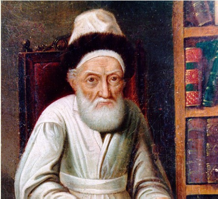
הוד כ"ק אדמו"ר הצמח צדק