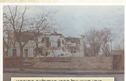
ביתו השני של הרבי בניקולייב בחורבנו.