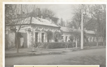
ביתו הראשון של הרבי בניקולייב היה כנראה בית סבו הרמ"ש יובסקי הנראה בתמונה. (מארכיון התמונות של אגו"ח. לא ברשמה שנת הצילום. נראית משנות השבעים).