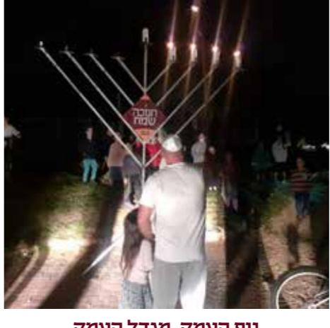
נוף העמק, מגדל העמק