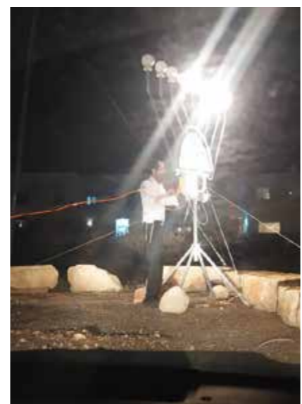
שכונת נחלים, עתלית