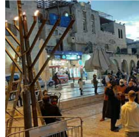
הרובע היהודי, ירושלים

מבצע חנוכה הגדול בכל הזמנים: למרות ההגבלות, שלוחי הרבי בכל רחבי הארץ הביאו את אור החנוכה לכל פינה. 'צעירי אגודת חב"ד' באלבום סיכום ראשוני כל הארץ אורה זה היה מבצע בלתי ייאמן: הגבלות הקורונה מנעו הדלקות המוניות, אבל שלוחי הרבי, כמיטב המסורת, דילגו גם על המהמורה הזו והביאו את אור החנוכה באופן אישי למאות אלפים מכל חלקי האוכלוסייה, לצד חשיפה של פרסומי ניסא למיליונים < אגפי הפעילות בצעירי חב"ד פעלו ללא הפסקה והעצימו את הפעילות לגבהים חדשים וחסרי תקדים: בקרב מאושפזים בבתי רפואה וקשישים בבתי אבות, עם משפחות נפגעות שרוו, עם דוברי רוסית וצרפתית, עם אנשי תקשורת ובקרב כלל עמך בית ישראל < יו"ר צעירי חב"ד הרב יוסף יצחק אהרונוב: "זה היה שבוע שבו השלוחים התמסרו ללא הפסקה לקיום הוראת הרבי להביא את אור החנוכה לכל יהודי. כמויות החנוכיות שהודלקו וחולקו, לצד הסופגניות וחומרי ההסברה שהופצו במאות אלפים, שברו שיאים חדשים" < יתרון האור