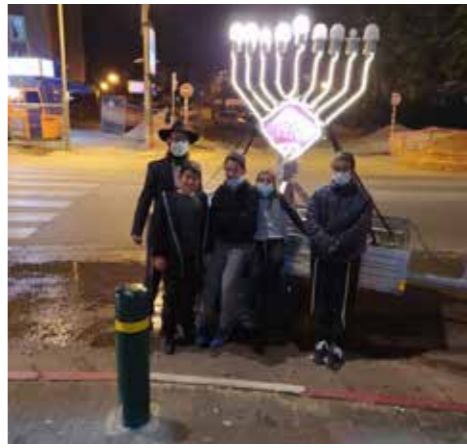
מערב שעריים, רחובות