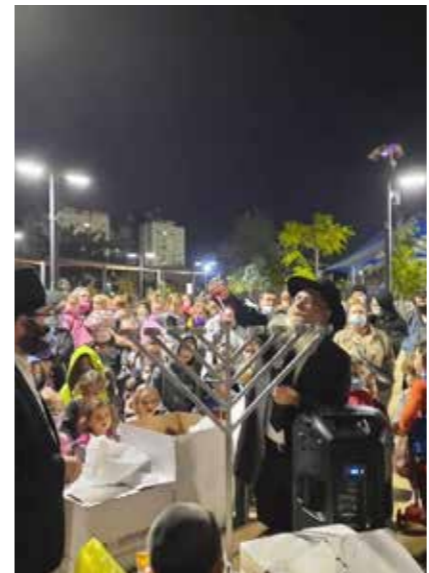
שערי עלייה, לוד