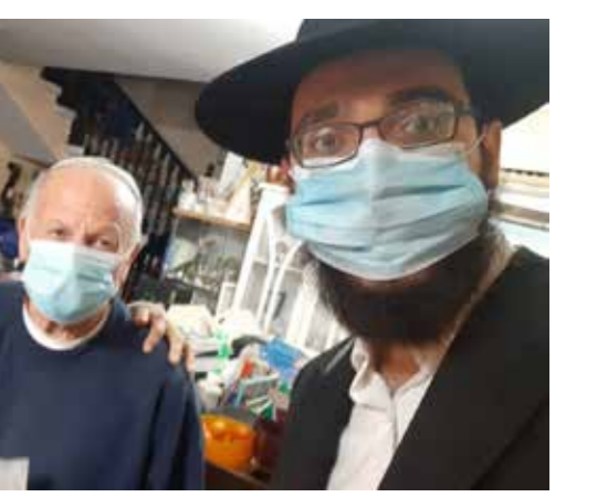
שכונות ממשלתי - עמידר ומתחם הרכבת, לוד