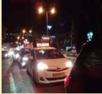
נווה שאנן, חיפה