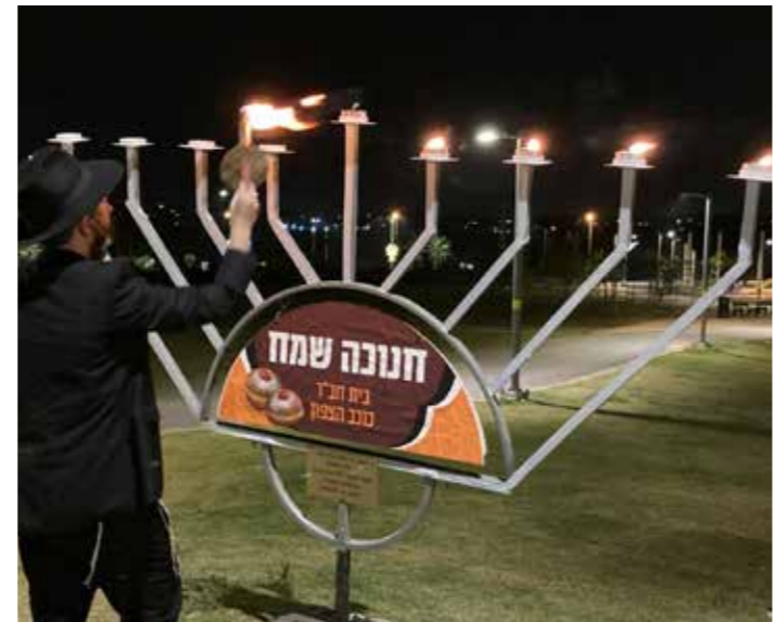
שכונת כוכב הצפון, נתניה