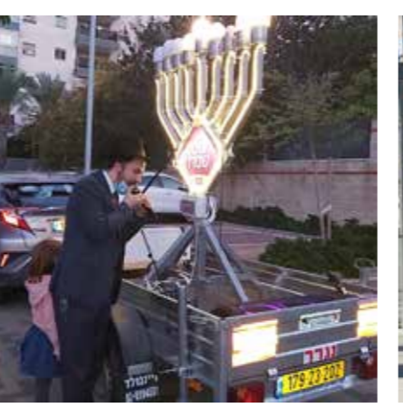
שכונת המדע, רחובות

מכל הלב לכל מאושפז אגף 'לב חב"ד' בצעירי חב"ד שלוחי הרבי בבתי הרפואה הוסיפו פעילות ביתר חיל בימי החנוכה דווקא השנה. כידוע, הורה הרבי במסגרת ההנחיות על פעילות ימי החנוכה, על החשיבות לבוא ולשמח את השוהים במרכזים הרפואיים. למרות ההגבלות שנושא עימו נגיף הקורונה, הצליחו השלוחים לארגן את הפעילות באופן המתאים כרצונו וכהוראתו של הרבי, ובמידה מסוימת עלתה הפעילות אף מעבר לסטנדרט בשנים הקודמות. ביותר בלטה השנה פעילות השלוחים, כאשר גם אנשים וארגונים המגיעים מפעם לפעם לפעילות זו או אחרת בחנוכה במרכזים הרפואיים נמנעו מלבוא בשל נגיף הקורונה, אך השלוחים לא ויתרו על המשימה והביאו את אור החנוכה לכל מאושפז במגוון דרכים ופעילויות יצירתיות. חנוכיית ענק הוצבו בפתחי המרכזים הרפואיים, מפרסמות את הנס למרחוק; ממחלקה למחלה וממסית אשפוז לרעותה עברו המתנדבים המופעלים בידי השלוחים והביאו את שמחת החנוכה; גם אנשי הצוותים הרפואיים זכו לעידוד וקיבלו מנה גדושה של שמחת חנוכה. ההכנות לפעילות חנוכה המיוחדת באגף 'לב חב"ד' בצעירי אגודת חב"ד, המרכז את הפעילות במרכזים הרפואיים, החלו שבועות ארוכים לפני בוא החנוכה. בסיוע המרכז לעזרי שלוחות הופקו חומרי עזר מותאמים לפעילות בימי קורונה במחלקות השונות והתוצאות ניכרו בפעילות בשטח. גם אנשי המטה במשרד הבריאות לא קופחו, ובמסגרת פעילות לב חב"ד אף נערכו טקסי הדלקת נר חנוכה במטה הקורונה של משרד הבריאות והוצבו חנוכיית לפרסום הנס במשרדים השונים.