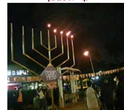
קריית שלום, תל אביב