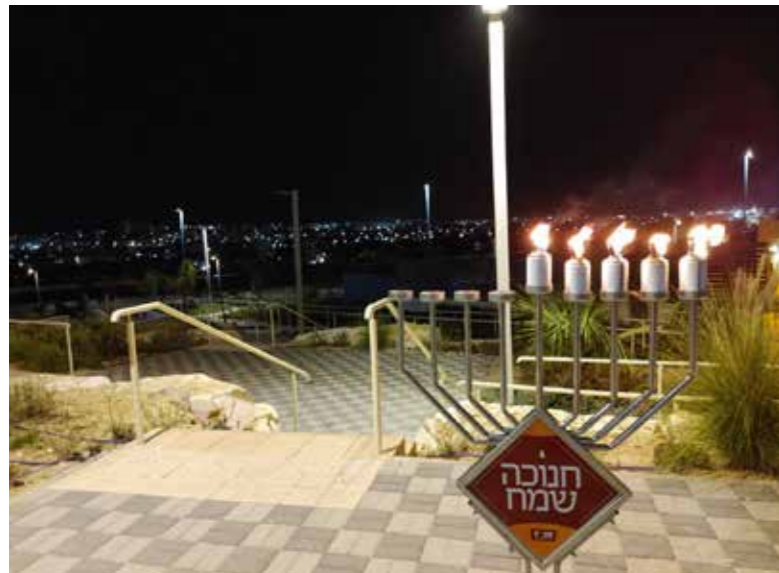
שכונת הר נוף, דימונה