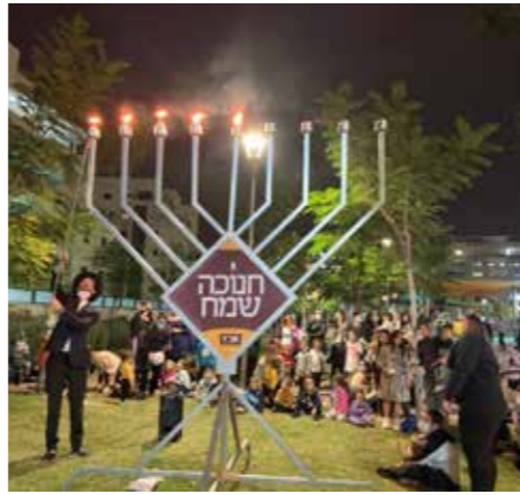
משכונת האומנים, קריות