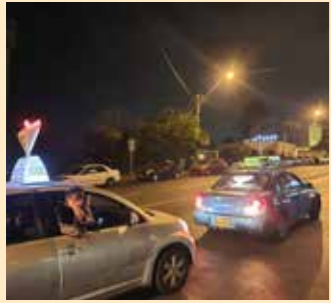
קריית אליעזר, חיפה