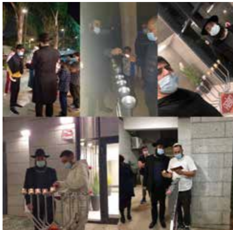
חצרות המושבה, רחובות