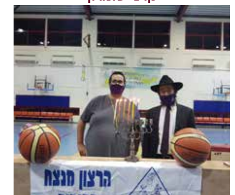
שכונת היובל, מקוב רחובות