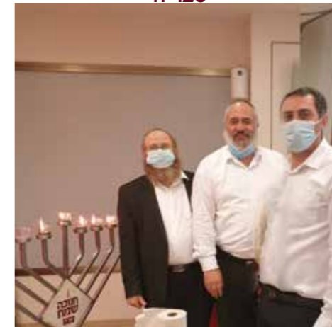
בנק הפועלים, כפר סבא