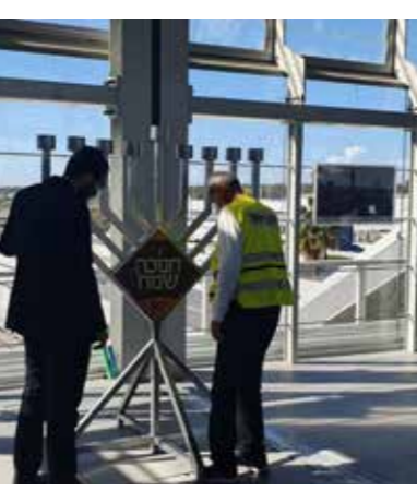
שכונת המדע, רחובות

גם בתוך מחלקות הקורונה, ההולכות ומתמלאות לצערנו בימים אלו, פעלו השלוחים והביאו את אור החנוכה. זאת בהתאם לכללים והנהלים הייחודיים למחלקות. שח לנו אחד ממנהלי מחלקות הקורונה במרכז הארץ, שבחר להישאר בעילום שם: "האור של לב חב"ד הוא כוח עצום שמאיר את המקרים החשוכים ביותר".