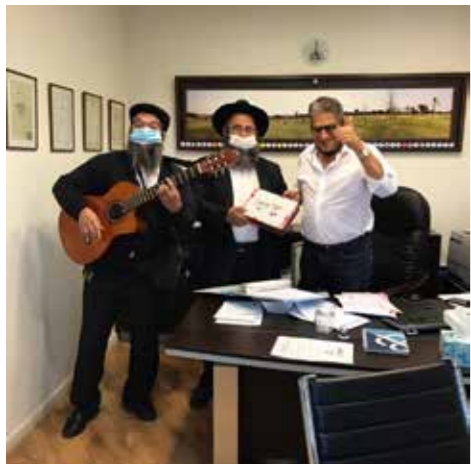
פארק עסקים, לוד גיליון 1888 | כפר חב"ד | 47