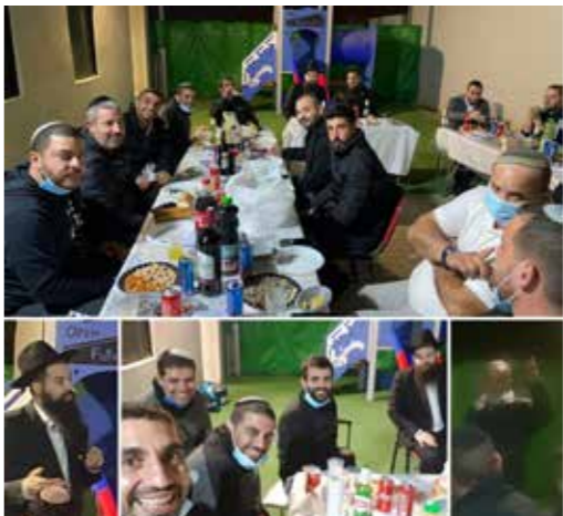
שכונת סגיליות, באר שבע