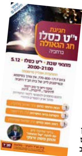
אחת ההזמנות להתוועדות חג הגאולה