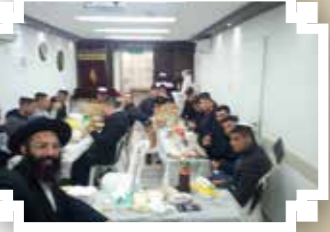
בית חב"ד לנועה, באר שבע