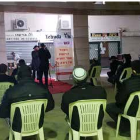
רובע ט, אשדוד