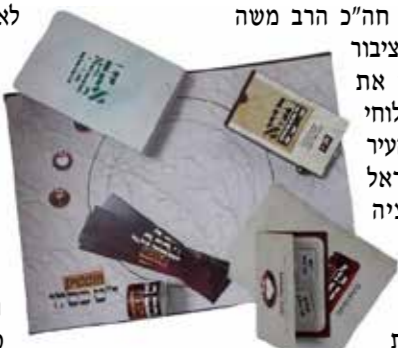
ערכת חג הגאולה של צעירי חב"ד - אחת היוזמות לרגל י"ט כסלו