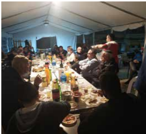
שכונת גרין ועם, חולון