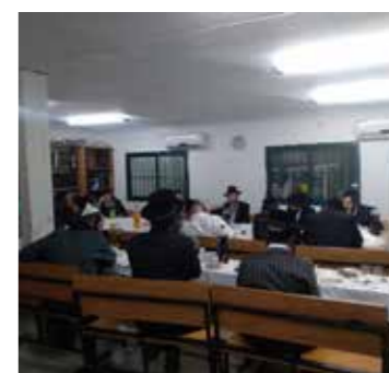
חפציבה, בית שמש