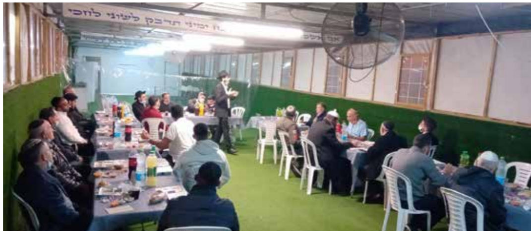
שכונת ביתר, חדרה