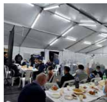
הר חומה, ירושלים