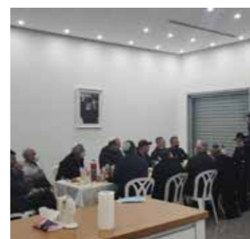
הר נוף, דימונה