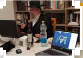
בית חב"ד המרכזי, באר שבע