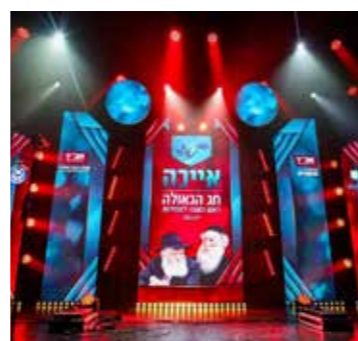
גבעתיים וגבעת שמואל