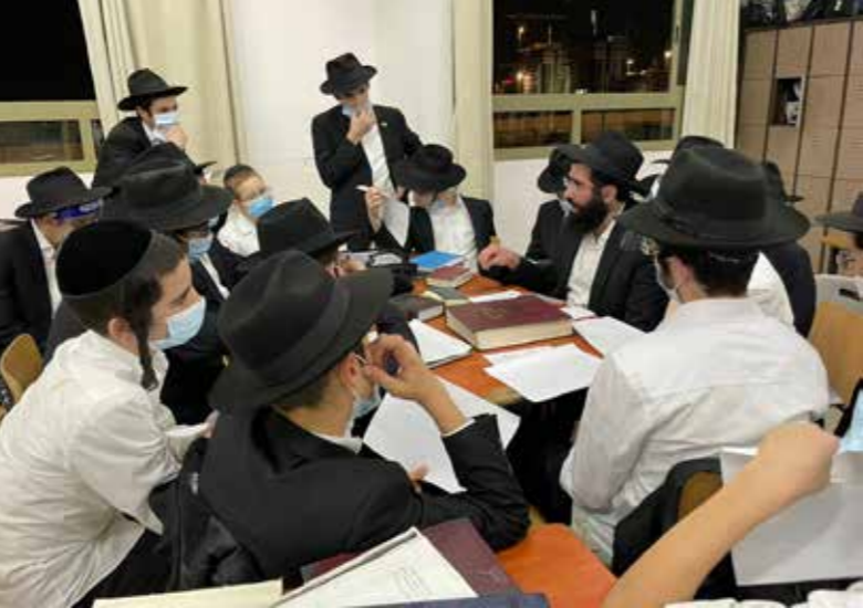
חתני חתונה חסידי חב"ד, חתן (במרכז) וכלתו (במחצית הימנית)

והנה המופת ע"ד שהתגלות עצם התענוג הוא בבחי' שחוק הוא שאנו רואים ד"מ מלך החוזר ממלחמתו בפחי נפש אינו להרויח דעתו רק מתוך שחוק שעושים לפניו מדברים הבאי' כידוע, לפי שאין להרויח דעתו לא מתוך כסף וזהב שכל זה אינו שוה לו בצער שלו רק מתוך שחוק מרויחים לו דעתו, והיינו לפי שהצער הוא היפך התענוג, והנה הצער שלו לפי שלא כבש המדינה או שהפסיד מדינתו שהוא הפסד שלו, הוא בחי' תענוג מורכב, ויש לו צער לפי שהפסיד התענוג מורכב, וע"כ מרוויח דעתו דווקא מחמת שחוק ששם התגלות עצם התענוג, וממילא בטל הצער שלו מחמת התענוג מורכב. והנה השחוק הזה הוא דווקא לע"ל לפי שאז יתגלה עצם התענוג. וע"כ אמרו אסור למלאות בעוה"ז כו' כמ"ש אז ימלא שחוק כו', וכן הצדיק שהוא (?) מיחד העולמות באצי' וממשיך תענוג מבחי' עצם התענוג, וע"כ