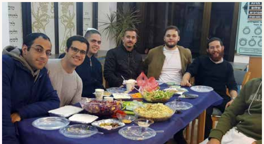
התוועדות חנוכה במכללת כרמיאל

הוא לדוגמה 'ניסוי מילגרם' שנעשה על ידי פסיכולוג יהודי אמריקאי שחקר עד כמה אנשים משילים מעצמם אחריות כאשר הם חשים שיש מישהו שמוביל אותם. התוצאות היו מהפכניות: מסתבר שאנשים היו מוכנים לעשות דברים די קיצוניים ברגע שהם חשו שיש מי שייקח אחריות על מעשיהם.