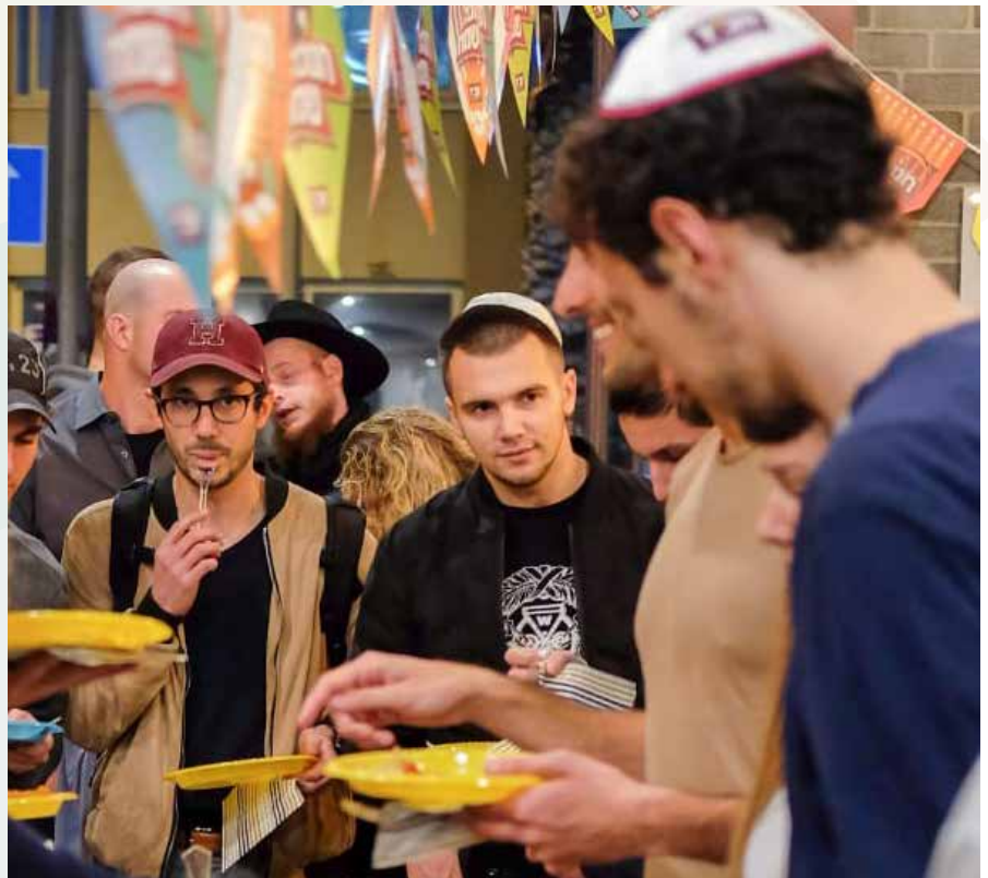
מסיבת חנוכה באוניברסיטת חיפה