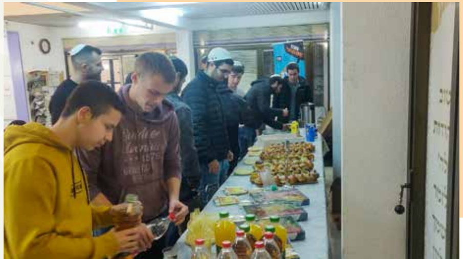
הדלקת נרות חנוכה במכללת אשקלון

"התגובות מהשטח היו מדהימות. מעבר לכך שהסטודנטים נהנו, מצאתי אותם דנים בתכני ההרצאה זמן רב אחר כך, התכנים הללו עוררו אותם לחשוב על המקום שלהם בתוך כל הסיפור הגדול שנקרא חנוכה"