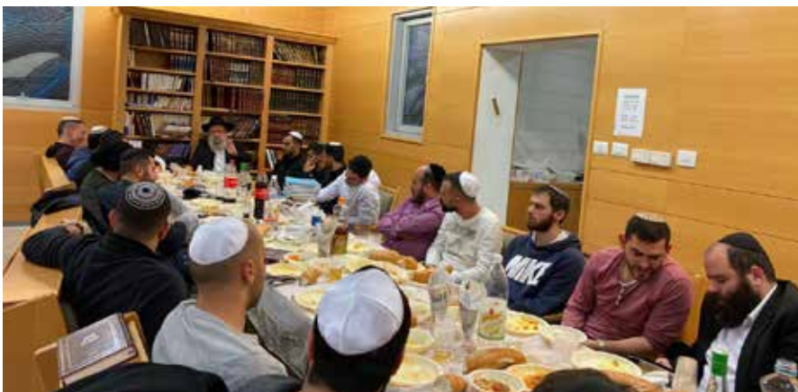
התוועדות במכללת סמי שמעון בבאר שבע

הרב כרמל משוכנע כי זוהי רק ההתחלה. "ההתוועדות משמשת אותנו כפלטפורמה