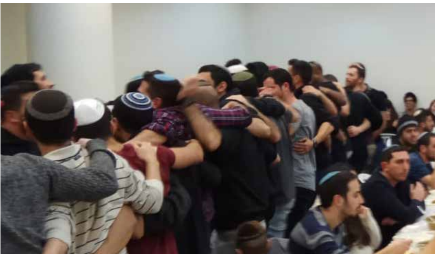
ריקודים באוניברסיטת אריאל