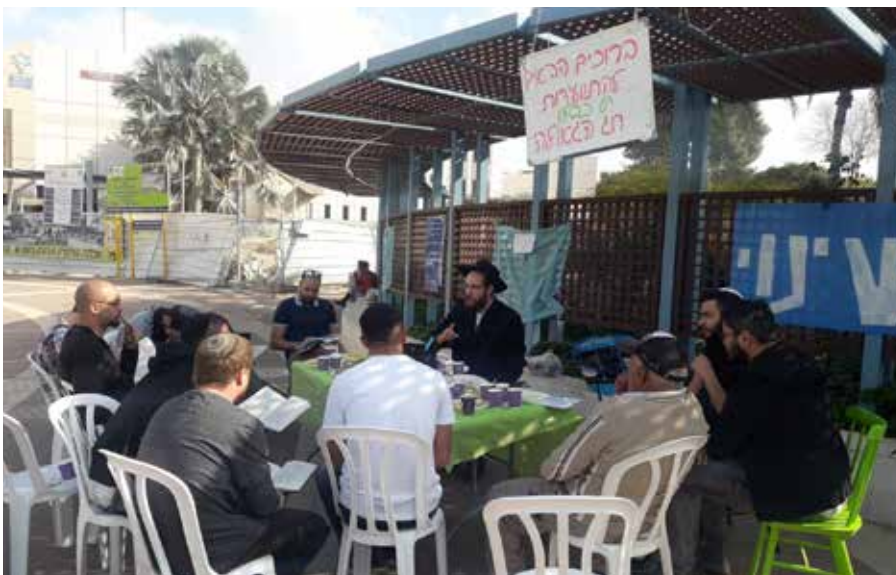
אחת מההתוועדות במכללת ספיר