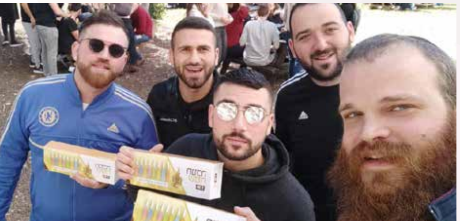
אלפי חנוכיות חולקו לסטודנטים. בתמונה - מכללת עמק יזרעאל

"הסיטואציה שתיארתי הייתה בבית האבות. הסטודנטים נכנסו עם מגשים של סופגניות ורמקולים עם שירי חנוכה, ופתאום ראינו איך זיק נדלק בעיניהם של הזקנים. זה היה כל כך בולט לעין, שראיתי כמה סטודנטים מתרגשים מהמחזה.