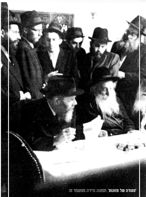
סעודה של מזונות, תמונה נדירה ממעמד זה

סעודה מיוחדת זו נערכה בכל שנה, עד שנת תשל"א.