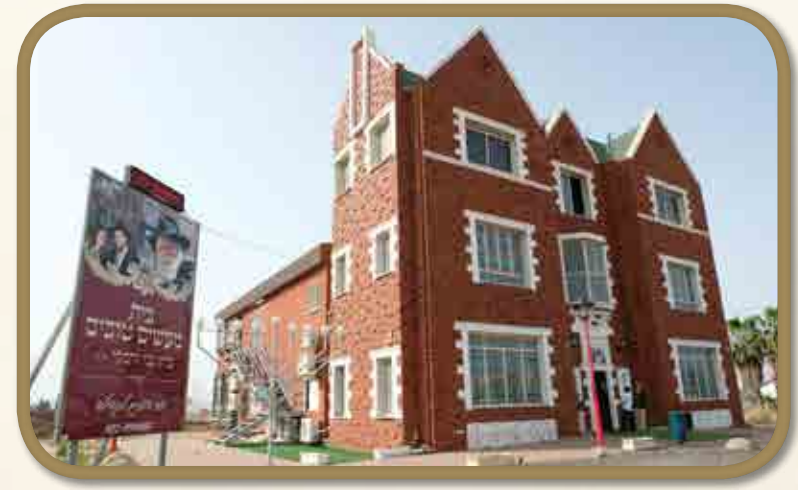
בית מעשים טובים - בית גבי ורבקי - עפולה