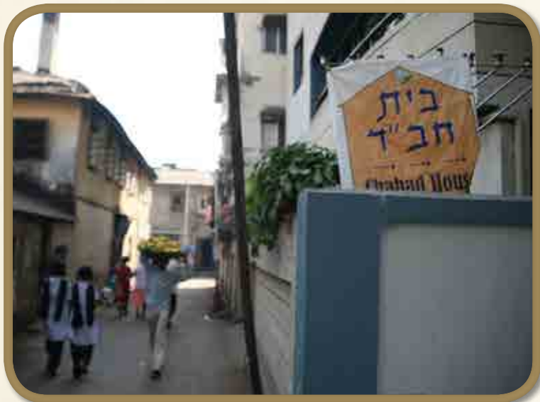
בית חב"ד נארימאן האוס