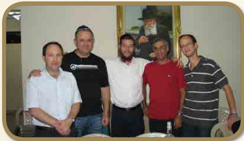
עם אורחים בבית חב"ד