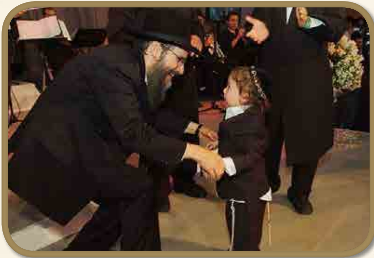
חוגג שלוש עם הזמר העולמי ר' אברהם פריד

אתר חב"ד אורג, פתח במבצע מיוחד בעקבות הטרגדיה - קבלת החלטות טובות וכל אחד יכול לכתוב החלטה טובה באתר האינטרנט, ותוך זמן קצר נרשמו באתר למעלה מעשרת אלפים החלטות טובות.