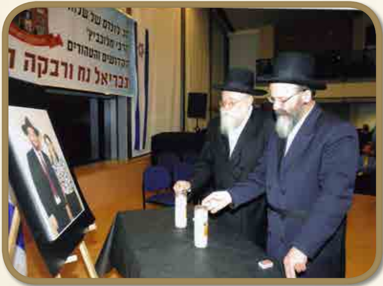
אירועי "שלושים" להרוגים בבית חב"ד מומבאיי