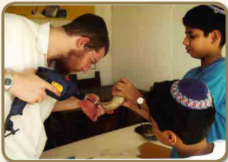
יצירת שופרות עם ילדי הקהילה המקומית

יש לנו שיעורים עם הקהילה היהודית המקומית, אני מוסר שיעורים לגברים ורבקי לנשים, ומלבד זאת יש בית ספר של יום ראשון המיועד לקהילה היהודית "בני ישראל", מדובר בקבוצת ילדים מגיל שבע ועד ארבע עשרה, המעבירים מידי שבוע, שלוש שעות של חוויה יהודית.