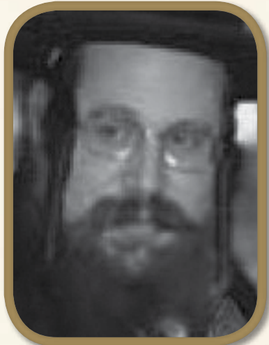
הרב גבריאל טייטלבוים הי"ד