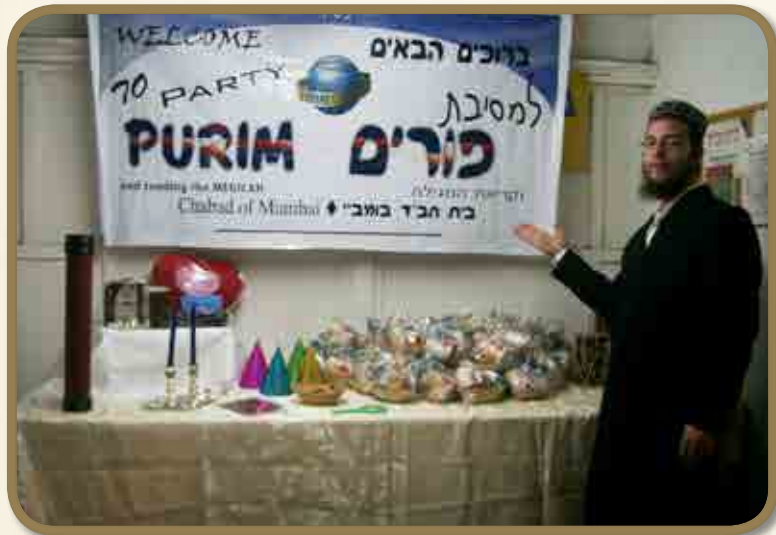
סעודת פורים וקריאת המגילה

חשוב להבין, בהודו, להאמין ב'שיתוף', זה דבר מובן מאליו. הגיע אלינו גוי אחד שקרא על היהדות ועל חב"ד באינטרנט. הוא התכתב עם עורכי האתר ואלו הפנו אותו אל הרב היהודי שהגיע לאחרונה להודו. הוא הגיע אליי לדירה. עם כניסתו, הוא רואה את ארון הספרים, הוא קד קידה עמוקה, במשך שתי דקות. בקיצור, הוא רצה ללמוד יהדות. אמרתי, מה, נעשה אותו יהודי? הרי להתחיל עם גירות זה הדבר הכי מורכב. אמרתי לו, בוא נלמד על שבע מצוות בני נח. הוא הוציא עט ודפדפת ורשם הכול.