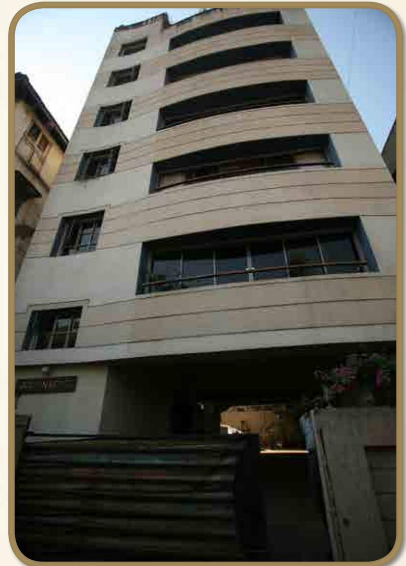
בית חב"ד נארימאן האוס