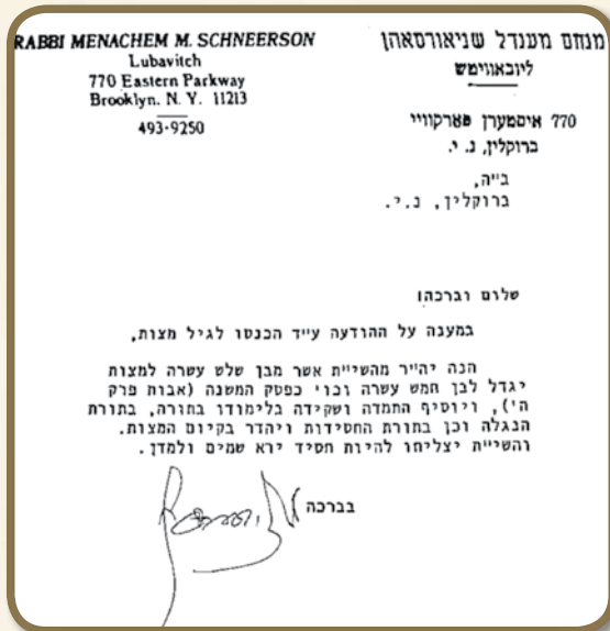
מכתב מהרבי לבר מצוה

השנתיים. המונים בכל רחבי תבל ראו בשידור חי או זמן קצר לאחר ההתרחשות, כיצד מושי יוצא מהתופת, וכולם לא הבינו, איך קרה הנס הגדול!?