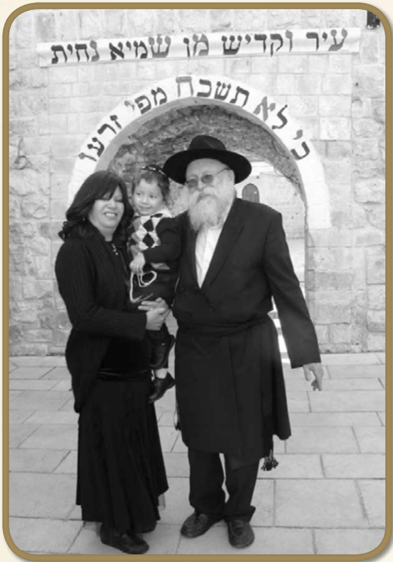
עם סבא וסבתא רוזנברג, במירון