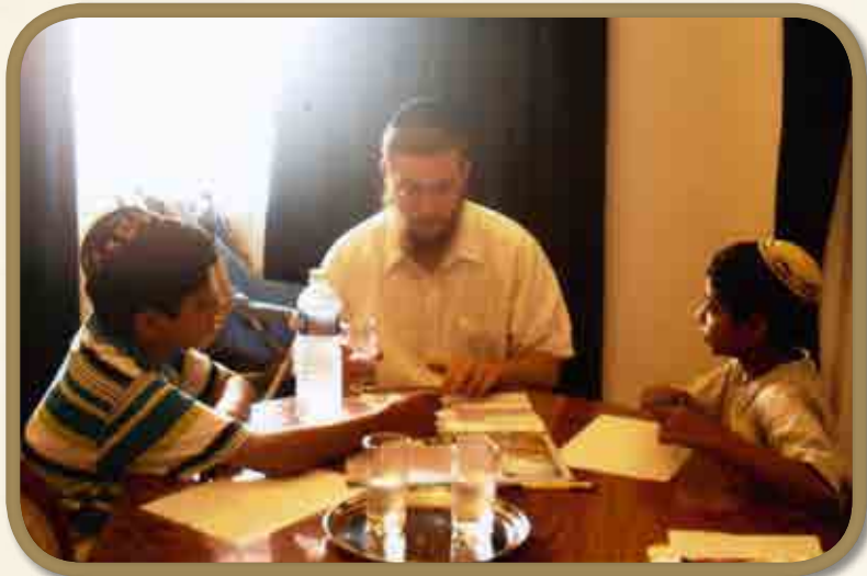
שיעור עם ילדי הקהילה המקומית

צורך דחוף בסכום גבוה נוסף ולבסוף מר ראהר העניק לגבי הלוואה על סך חצי מיליון דולר! וכך הרכישה יצאה לדרך.