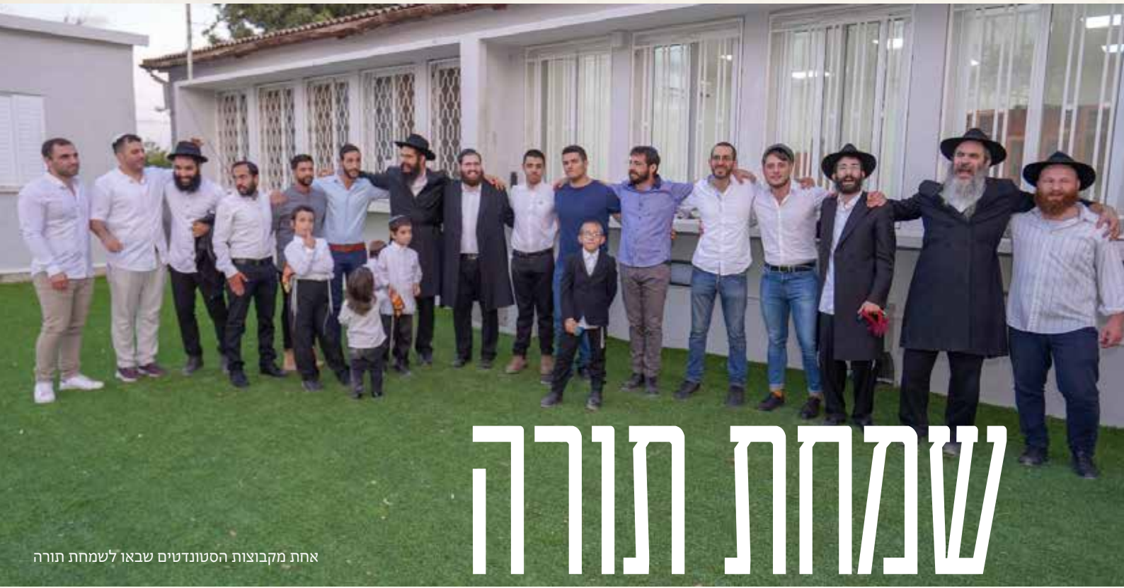
אחת מקבוצות הסטודנטים שבאו לשמחת תורה