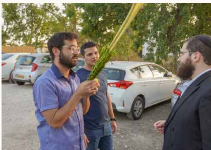
נטילת לולב וחביטת ערבה ברגעים האחרונים של חג הסוכות