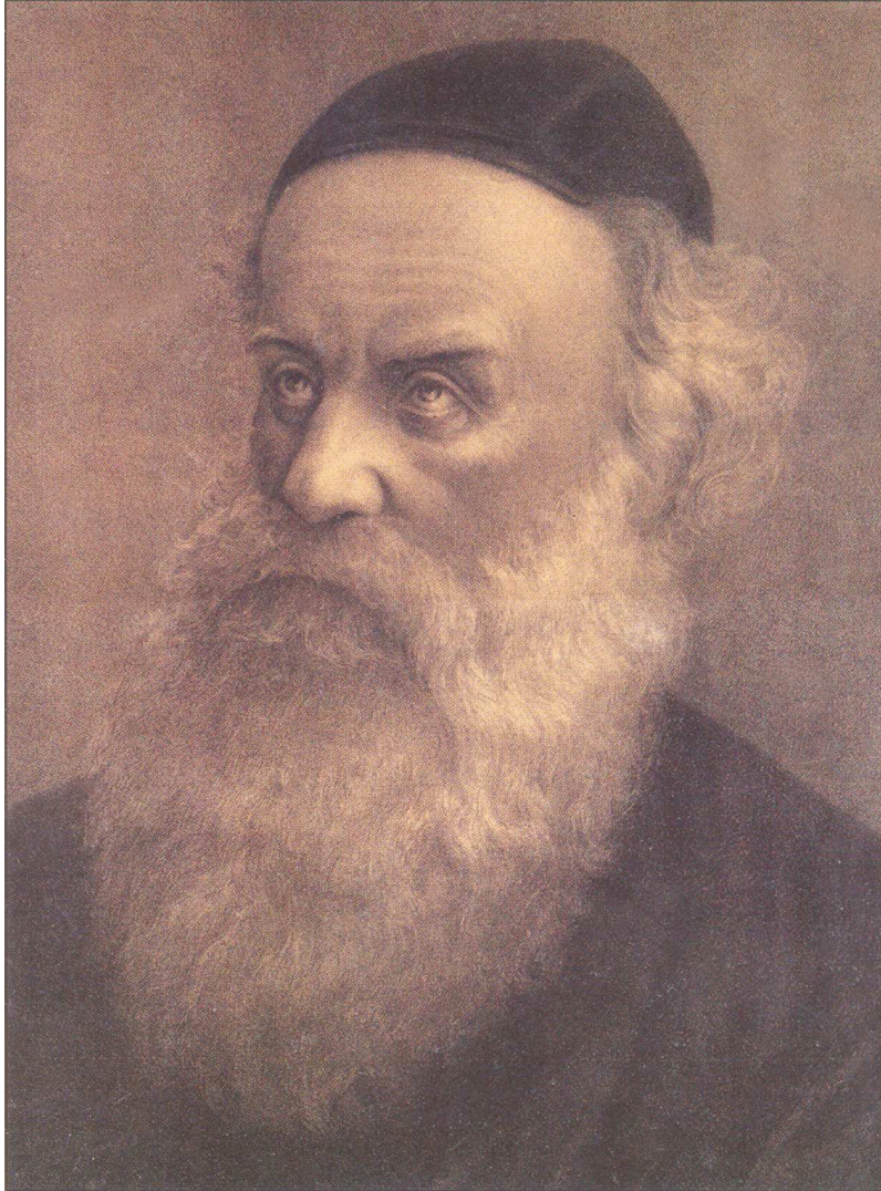
תואר פני כ"ק אדמו"ר הזקן