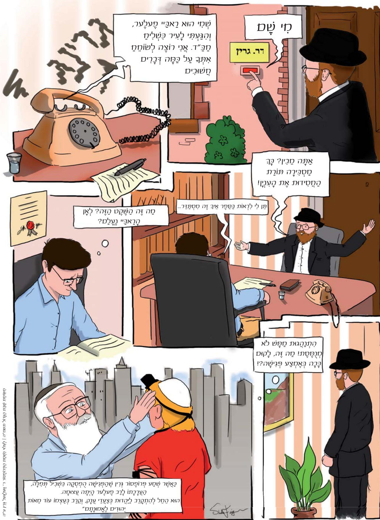
קומיקס שכתב בדפני חשפיר | לצייר נטמת ספירוסור ר' זוקלובל ג'וזי ג'וזי