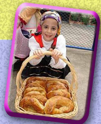
וילהלם בנגוק תאילנד

שלחו את פתרונותיכם ל- beshlichut@gmail.com וצברו 5 נקודות עבור כל משחק. בהצלחה