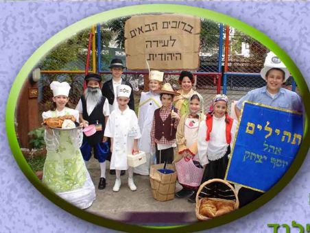
ווילהלם בנגקוק תאילנד

שלחו את פתרונותיכם ל- beshlichut@gmail.com וצברו 5 נקודות עבור כל משחק. בהצלחה