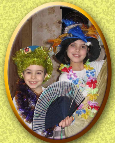
בורשטיין סרטוב רוסיה