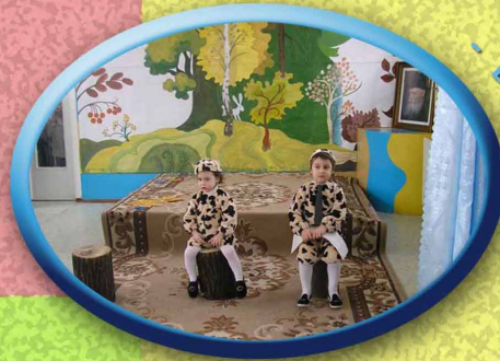
מזיקנס צרימוב פורים - מענדי ושניאור