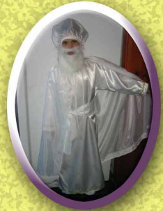
שלום דובער קוביטשעק סרטוב רוסיה