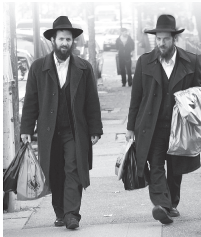
הבנים (האבות) שלוחים בנשר ובגן יבנה

סיפור ראשון סיפר לנו אחד מאנ"ש, שכשהוא היה בצבא הוא פגש יהודי בפרדס חנה שלא יכול היה