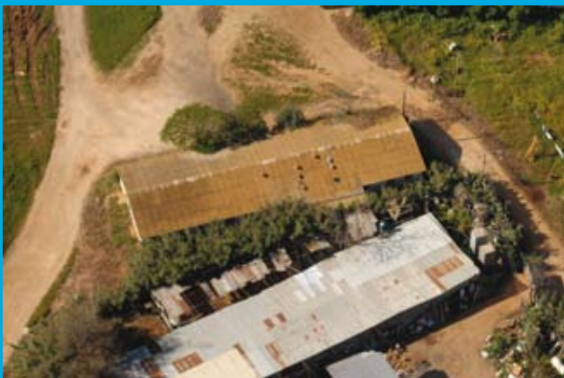
מכינים את הקרקע. איזור הבניה העתידי סמבט אוירי

פרטים להשתתפות והנצחה בבניין יפורסמו בקרוב.