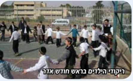
רקודי הילדים בראש חודש אדר