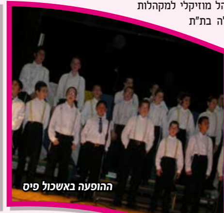
ההופעה באשכול פיס