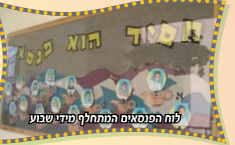
לוח הפנסאים המתחלף מידי שבוע

לפני מאות שנים עוד לפני שזרם חשמל לתאורת העיר עמדו בצידי הרחובות עמודים שבראשם היה פח נפט ובכל ערב כאשר החל להחשיך היה עובר אדם עם מוט גדול שבראשו לפיד ומדליק את מנורות הנפט כדי שיהיה אור בכל העיר לאדם הזה קראו -פנסאי-. הרבי הריי"צ אומר כי כל חסיד הוא 'פנסאי' לכל חסיד ישנו תפקיד להאיר את סביבתו ע"י מעשיו ועל ידי לימוד תורתו, תפקידו להדליק 'מנורות' בכל מקום שהולך ושהתנהגותו תהיה חסידיית וראויה, בכל שבוע תולים בת"ת את תמונותיהם של פנסאי השבוע, אלו שהאירו את סביבתם במעשיהם הטובים וכלימודם, אותם פנסאים - שני תלמידים מכל כיתה שנבחרים בכל שבוע לכבוד הגדול הזה זוכים שתמונותיהם תתנוססנה בתוך פנסי