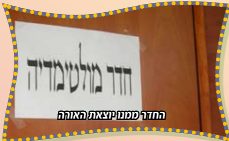
החדר ממנו יוצאת האוהה

את מצגת המולטימדיה המוצבת בלובי הת"ת כבר כולם מכירים אך כמו כל דבר בת"ת חב"ד נתניה שום דבר לא נישאר על מקומו ולכל דבר מוצלח מוסיפים שדרוג בבחינת "ילכו מחיל אל חיל" מלבד המחשב החדש שנקנה במיוחד למצגת סדר חדר מיוחד לצוות התלמידים שמונו ע"י ההנהלה כצוות עריכה של מצגות