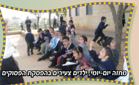
מחזה יום-יומי, ילדים צעירים בהפסקת הפסוקים