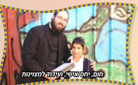
חום, יחיאשי, ועידוד למצינות