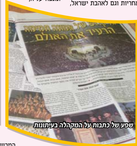
שפע של כתבות על המקהלה בעיתונות