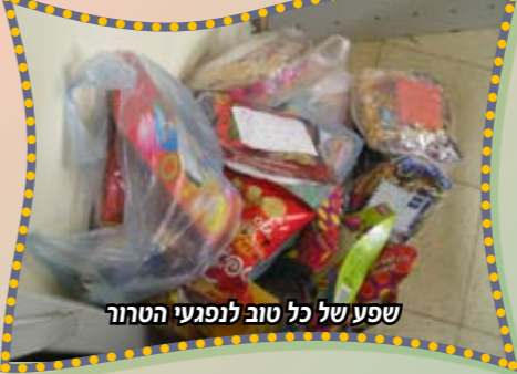
שפע של טוב לנפגעי הטרור

לא יכלו לדבר ורק איחלו לה במבוכה ילדותית שנה של גאולה שלימה.