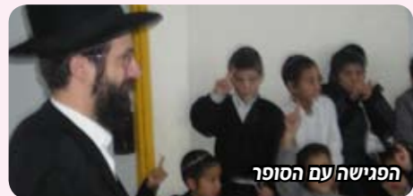
הפגישה עם הסופר

המבצע חולק לשלבים שונים התלמידים פתחו ספרים ומקורות רבים בכדי לברר על תולדות הנשיאים, הכל שיננו את החוברת בשביל להיות מוכנים למבחנים שהתקיימו בכל שבוע ורק שלושה תלמידים מכל כיתה זכו לעלות לחידון שהתקיים באולם הכינוסים של