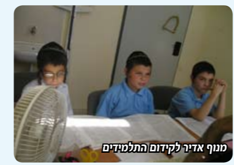
מונף אדיר לקידום התלמידים

רמת לימוד הגמרא בת"ת, הר"מים החשובים הצביעו בהערכה על מקצועיות הצוות והכוחות האדירים שמשקיעים המחנכים, כיוונו את הפוקוס אל בעיות שרק אדם חיצוני עם ידע מקצועי יכול להצביע עליהם, ודאגו שכל תלמיד יקבל את הקידום המתאים לו ושח"ו אף אחד לא יישאר מאחור. לאחר כל מבחן שכזה מבצעת ההנהלה אסיפה בה מוצגות המסקנות מהמבחן, הוראות לשיפור, בדיקת התקדמות התלמיד מהמבחן הקודם, ושליחת