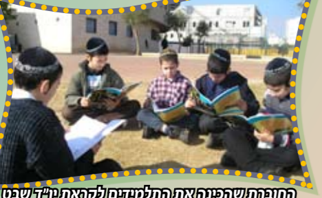
החופת שהפנה את התלמידים לקראת יו"ד שבט

ובחשך רב ממלאים את המשימות בחבורות הנפלאות שהוכנו הכול בכדי שנהיה מוכנים כיאות לקראת יו"ד שבט, כמו כן קיבלו על עצמם כל התלמידים החלטות טובות כמתנה שיתנו לרבי לקראת יו"ד שבט, את 215 המתנות הגשנו לרבי בכינוס הגדול ביד אליהו במעמד מרגש ומיוחד, וכחסידיים אי אפשר ביום כזה מיוחד שלא לתת מתנה משותפת לרבי, ואכן בכל יום שישי מחולק דף מיוחד בשם "המנה העיקרית" הגדוש בהלכות ומנהגי שבת משובץ בסיפורי חסידים, אותו קוראים הילדים בכל