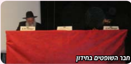
חבר השופטים בחידון