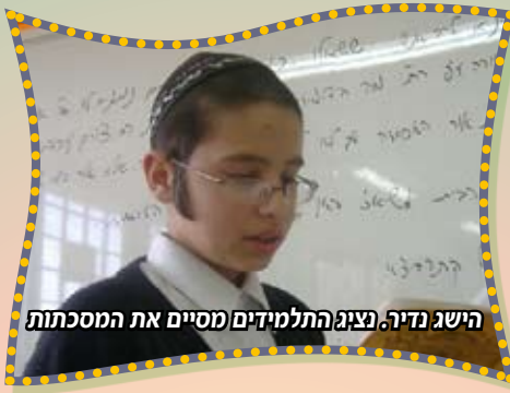
הישג נדיר. נציג התלמידים מסיים את המסכתות

לחגיגת הסיום הוזמן יו"ר המוסדות ורב הקהילה הרב ולפא שליט"א שריתק את התלמידים במשך שעתיים