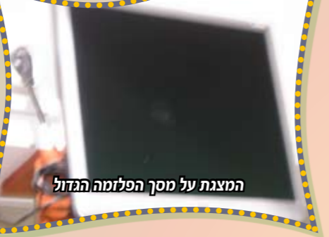
המצגת על מסך הפלזמה הגדול

המולטימדיה ונקנה מסך פלזמה גדול ומשוכלל להעביר את המראות ביתר חדות וצבע, הדבר מוסיף מרץ רב בקרב התלמידים הנמנים על "צוות המולטימדיה" להשקיע את כישורונותיהם הברוכים למען התלמידים ולמען הוספת חיות חסידית בדרכים מקוריות ומפתיעות בראש צוות המולטימדיה עומדים 'הת' בעוז לוי והת' יחיאל אלפנבין.