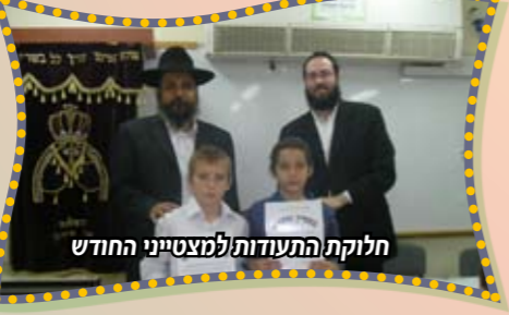
חלוקת התעודות למצטייני החודש

במסגרת המאמץ להביא את תלמידינו למצוינות בכל המקצועות ובהתנהגות חסידית נאותה, מקפידים אנו על קיומם של כינוסי "מציטיני החודש" המתקיימים במעמד הורי המצטיינים, כינוסים אלה הם שעה של קורת רוח ושובע נחת,את כל המשתתפים משמח ומרגש לראות איך "הנבחרת החודשית" זוכה ומקבלת תעודת הערכה על המאמצים הכבירים להעפיל מעל כל תלמידי כיתתם ולהגיע לשלב הסיום כמציטיני החודש. כינוסים אלה גורמים לקנאת סופרים שמרבה חוכמה בכל הכיתות וגורמת לתלמידים לעשות מאמץ גדול יותר להשתפר ולהגיע למצוינות. לא פעם מגיעים לכינוסים מעין אלה גם סבים וסבתות של הילדים ואלו לא מסתירים את התרגשותם ומנגבים דמעה סוררת מהתרגשות.