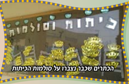
הכתרים שכבר נצברו על סולמות הכיתות

מי לא היה רוצה להציג את פירות המוסד שלו מול עשרת אלפים איש ומול כל מנהלי בתי ספר חב"ד בארץ? כנראה שכל אחד היה רוצה אבל לת"ת חב"ד נתניה זה קרה במציאות. כחודשיים קודם הכינוס האדיר, מכתמים מארגני הכינוס הגדול אנשי רשת "אוהלי יוסף יצחק" את רגליהם ממוסד למוסד ובין בית ספר למשנהו בכדי לראות אילו תוכניות מעניינות יש למוסדות ולבתי ספר להציע ואיך יוכלו להביע את עצמם בשפע רעיונות מול קהל של עשרת אלפים איש, תחרות גדולה קיימת בין בתי הספר אך לבסוף לאחר בדיקה מדוקדקת של מארגנים ואנשי מקצוע רק מעט מבתי הספר יופיעו לבסוף על הבמה