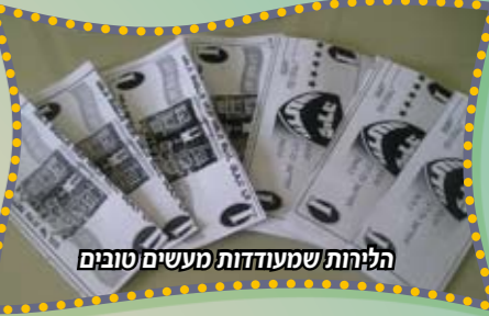
הלהות שמעודדות מעשים טובים

המוזרות. אין ספק כי בכינוס השנה הייצוג המכובד ביותר של נתניה נתן את אותותיו במשך כל הכינוס.