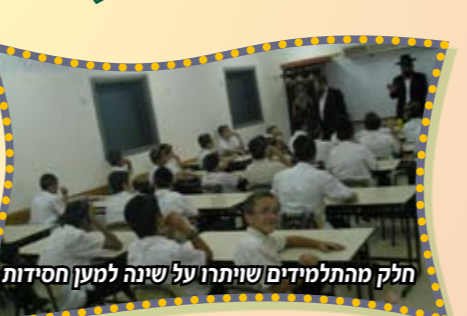
חלק מהתלמידים שיתרו על שינה למען חסידות