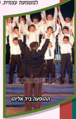
ההופעה ביד אליהו

בשכונת נאות גולדה בנתניה ההופעה הייתה חיה לגמרי ללא עזרים של פלייבק והתגובות מכל הקהילה שהגיעו היו חמות ומעודדות גם העיתונים כתבו דברים חמים, התמונות של המקהלה מילאו את העיתונים ואתרי חב"ד ברשת.