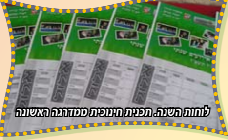
לוחות השנה. תפנית חינוכית ממדחנה האשונה