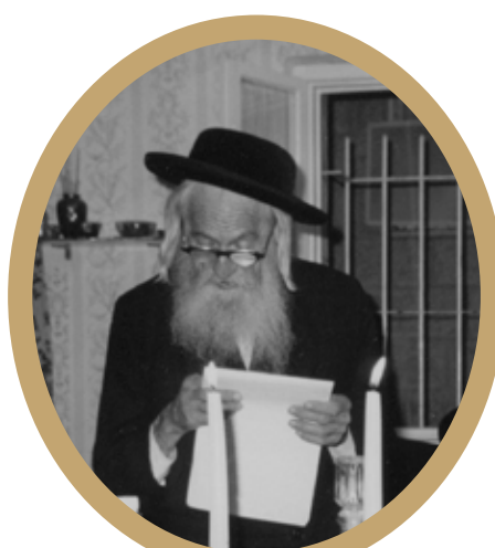
רבי הלל שלעזינגער