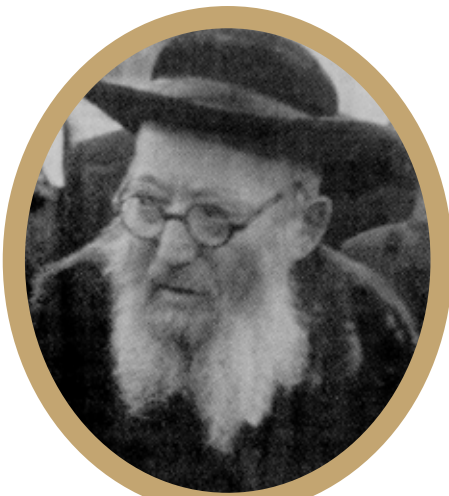
רבי אליעזר לדרברג