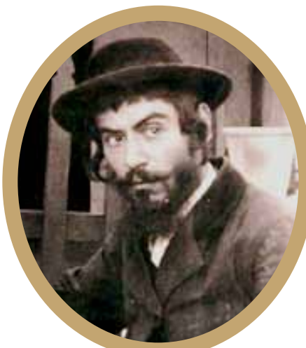
רבי אברהם אהרן זאנענפעלד