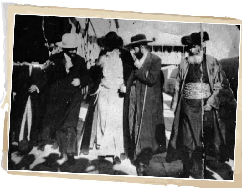
מורא דארעא דישראל מרן הגר"ח זאנענפעלד, לשמואלו נכדו רבי מנחם מואניש שיינברגר ולימיו פרופ' ד"האן הי"ד

נולד בבאניהאד (באנהארט) לאביו הג"ר משה פריעדן מלייפניק דיין בבאניהאד במשך שלושים שנה (נפטר כ"ו באד"א תקע"ב או תקפ"ו) ולאמו בת הג"ר אליעזר קוניץ המובא בשו"ת חתי"ס בתארים: "אדם קשה כבדול, החסיד החרוץ המופלג" ומוזכר גם בשו"ת "תשובה מאהבה". שם משפחת