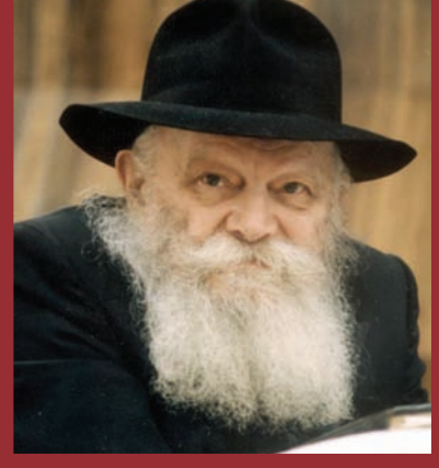
הרבי מליבאוויטש. 'שיחות לנוער' כהשראה ל'שיחת השבוע'