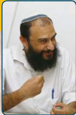
הרב עמי: "חושבים שהאמהות התפללו כי לא היו להם ילדים, אבל האמת היא שלא היו להם ילדים כדי שיתפללו".

אני חושב שכל הנושא של תפילה כנוס בשתי המילים: עבודה שבלב. יש מחלוקת מפורסמת בין הרמב"ם לרמב"ן, האם התפילה היא מצוות עשה מדאורייתא או לא. הרמב"ם אומר שמצווה להתפלל כל יום, והרמב"ן אומר שהמצווה איננה יומית אלא רק בשעת צרה. זה נראה לא טוב, אדם שכל השנה שוכח את ה' ורק כשהוא בבית חולים הוא פתאום מוציא תהילים ומתפלל, אבל הרמב"ן אומר: כן! מתי תפילה? כשאתה מגיע למקום העמוק והקשה שלך, אז תפילה היא מדאורייתא. הרמב"ם אומר כל יום. במונח הזה, עבודה שבלב היא עבודה, אדם קם בבוקר והולך לעבודה, רוצה או לא. כמונח שכשאנחנו מדברים על עבודה שבלב, שהיא עבודה פנימית, אבל המחויבות היום יומית היא חזקה, תבין שצריך לעבוד, עם חשק וגם בלעדיו.