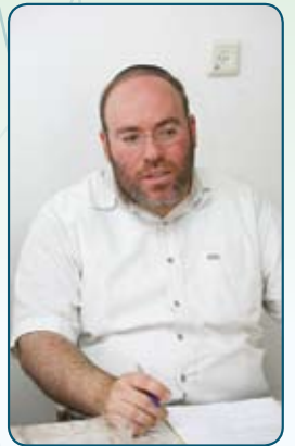
הרב אליקים: "אם אתה מגיע לדרגה מסוימת אתה יכול להרגיש את הליטוף, את אותו הקשר שמגיע בפידבק חוזר".

לו שהוא רב. אז הוא אומר לו: 'סליחה, אם הייתי יודע שאתה רב הייתי נותן לך מיטה'. אחרי התפילה הרב עומד ודורש באריכות, אז היהודי מברך אצל אנשים, ואומרים לו שזה רב של עיר גדולה. בדרך חזור הוא שוב מתנצל: 'אם הייתי יודע שאתה רב של עיר גדולה הייתי נותן לך חדר מסודר עם מיטה גדולה ושולחן ללמוד'. בסוף, כאשר הוא יוצא בערב, מלווים אותו הרבה אנשים, ואז נודע למארח שהרב הוא גם רבי גדול עם הרבה חסידים. אז הוא נשכב לפני הסוסים ואמר: 'אם הייתי יודע, הייתי נותן לך את המיטה שלי'.