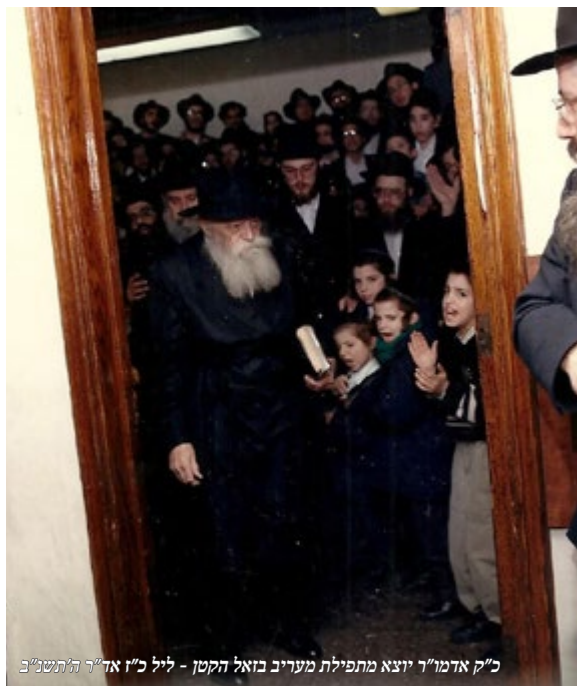
כ"ק אדמו"ר יוצא מתפילת מעריב בזאל הקטן - ליל כ"ו אדר ה'תשנ"ב

שיחת הק' הראשונה היתה מיוחדת במינה. היא נמשכה כארבעים